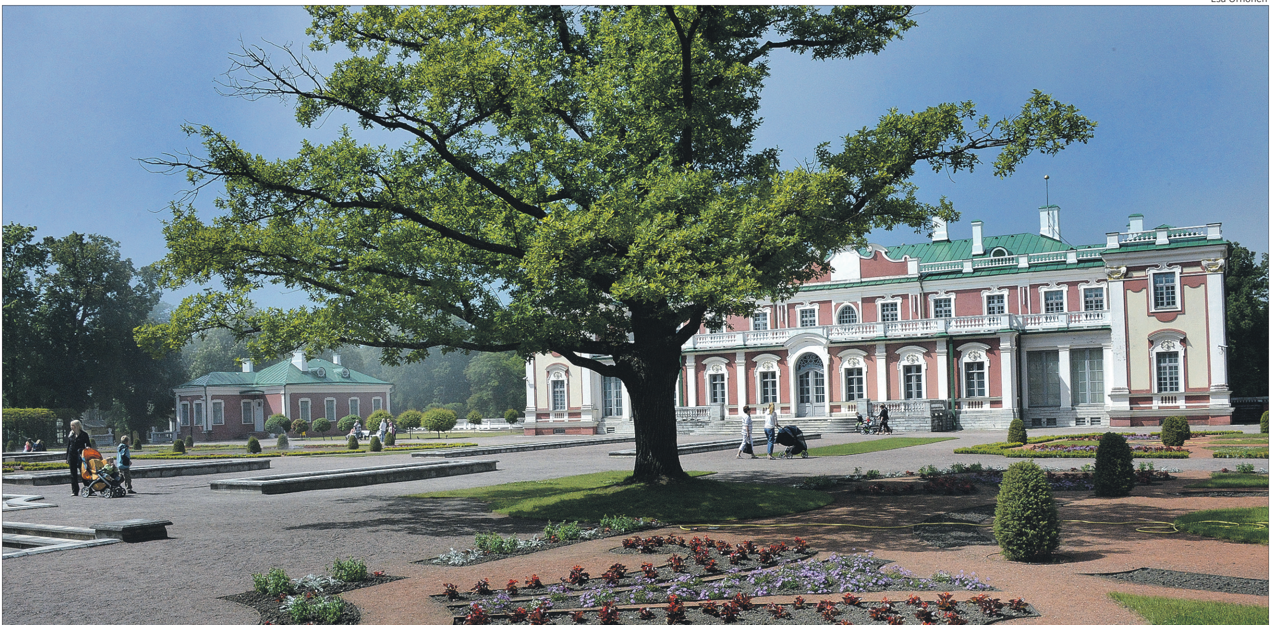
Kadriorgin palatsialue on näkemisen ja kokemisen arvoinen. Puistoalueelle pääsee kätevästi raitiovaunulla Tallinnan keskustasta. Kuvan yläpiha on vain pieni osa 85 hehtaarin alueesta.