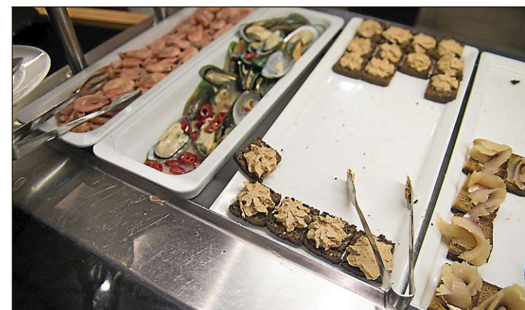
Vertailussa paljastui, että laivojen buffetien heikkous on kahvi: se oli joka paikassa kelvotonta.

Plussat: ▶ Parhaat aikataulut kahdella laivalaamuvaihtelulla ilta- ja aamu-