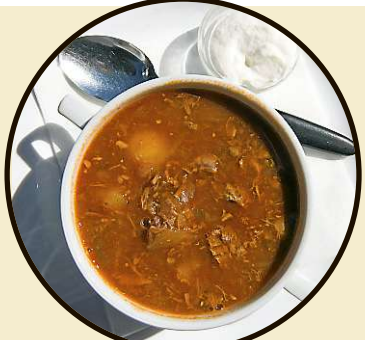
Päivän keitto on Grill House Revaliassa kevyt vaihtoehto.

5 Kelm. Paikallisten uudeksi ja ”cooliksi” tituleeraama baari vanhassa kaupungissa. Kapakan