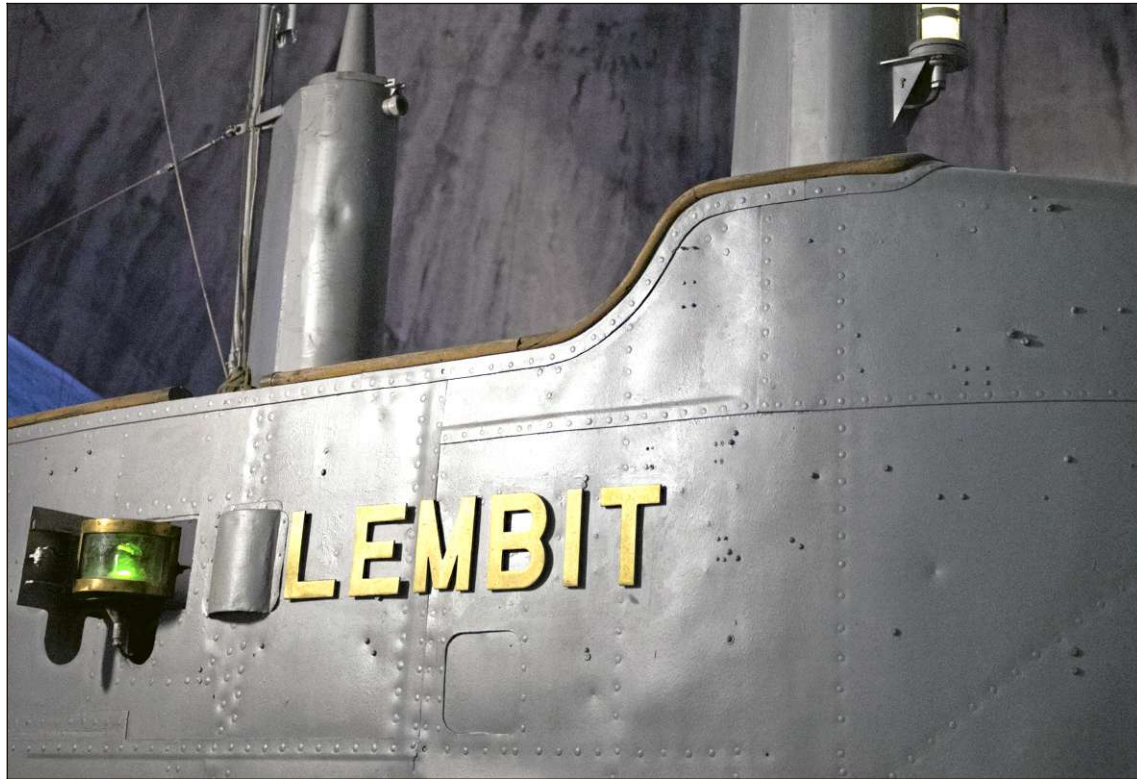
Lembit on yksi harvoista toisesta maailmansodasta ehjänä selvinneistä sukellusveneistä.