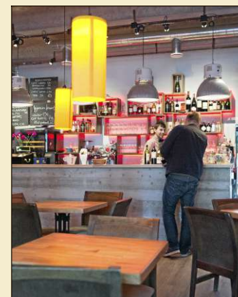
Shvips sijaitsee trendikaupunginosassa Kalamajassa.

2 Grill House Revalia. Ravintolaa ei voi suosittelua kuin