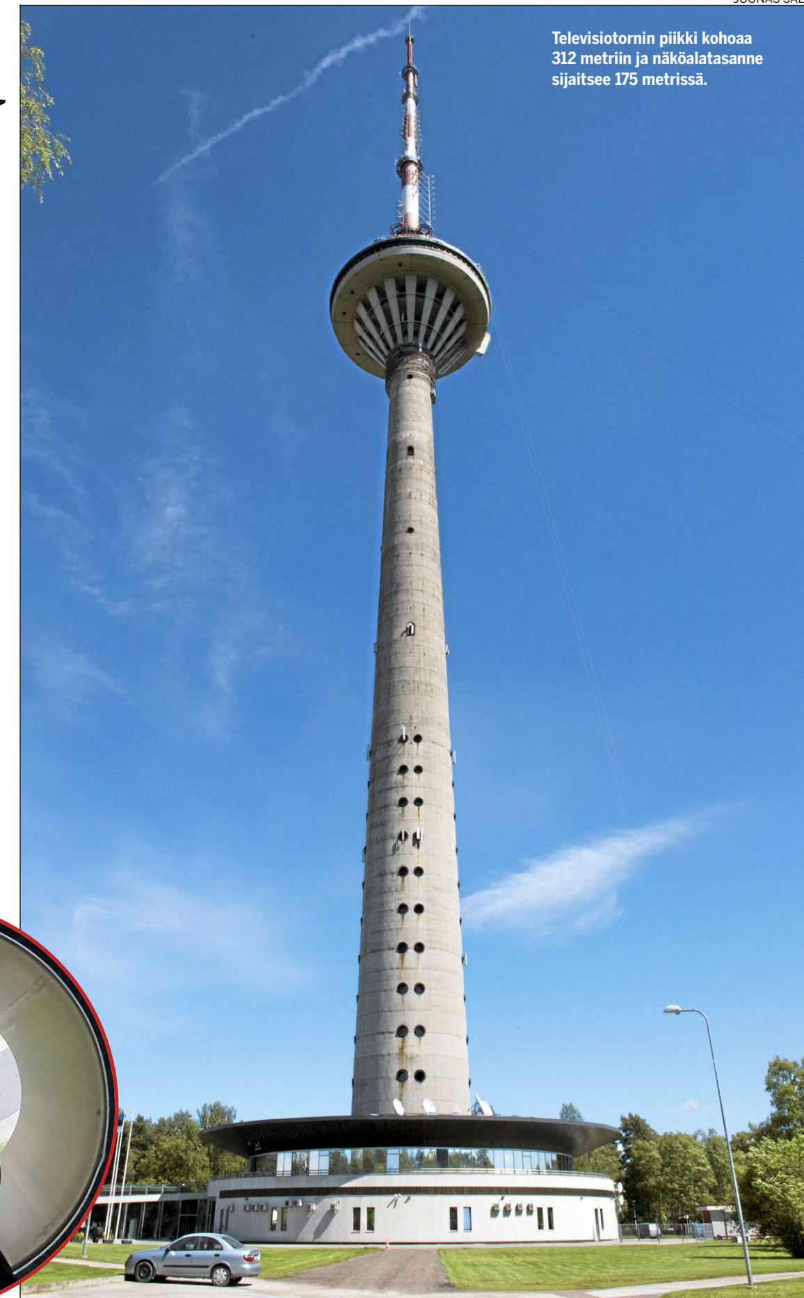
Televisiotornin piikki kohoaa 312 metriin ja näköalatasanne sijaitsee 175 metrissä.