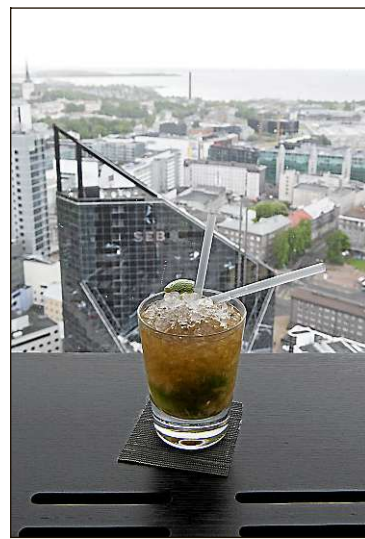
Horisont ei ole Tallinnan halvimmasta päästä. Klassikkodrinkit kuten Cairoskan maksavat ravintolassa noin kymmenen euroa.

Noin puolen tunnin taksimatkan päässä, Koillis-Talinnassa sijaitsee rantaravintola Paat, josta näkee sekä Tallinnan siluettin että Suomenlahden. Pääruoaksi veden äärellä kannattaa tilata sitä, mitä