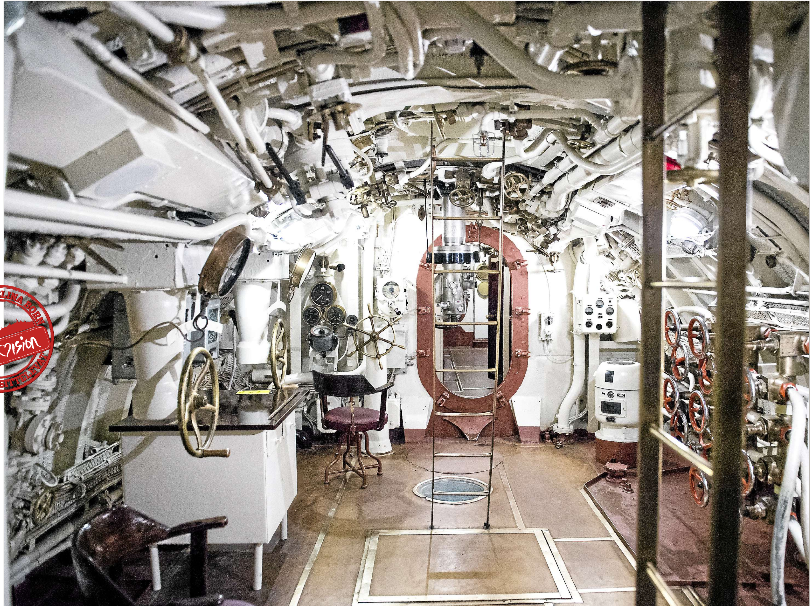
Sukellusvene Lembitin sisätilat.