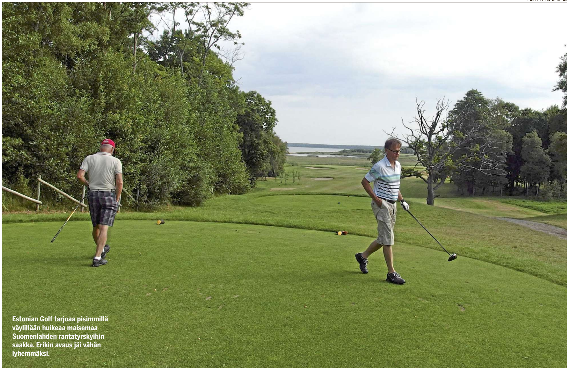
Estonian Golf tarjoaa pisimmillä väylillä huikeaa maisemaa Suomenlahden rantatyrskyihin saakka. Erikin avaus jäi vähän lyhemmäksi.