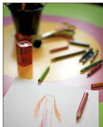
Lastenmuseossa on tarkoitus leikkiä, ei vain katsella vitriininlasien läpi.

TERO KARJALAINEN tero.karjalainen@iltasanomat.fi