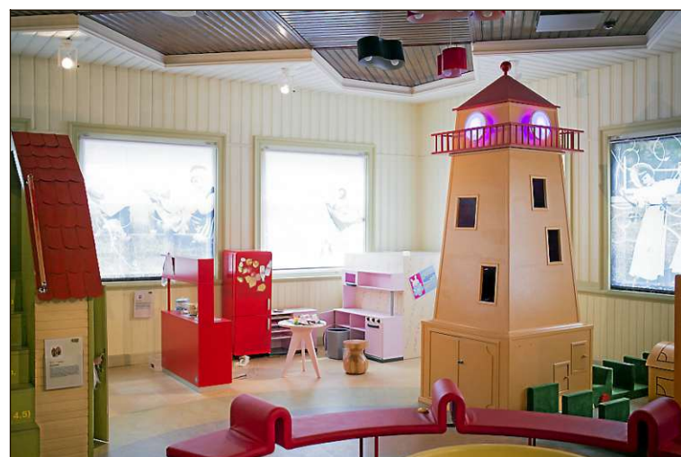
Lastenmuseota suositteluaan 3-11-vuotiaille.

3 Kalevin marsipaanimuseo. Lapset saattavat äityä lomalla villeiksi, ja kierroksia voi nostattaa raskaalla sokerihumalalla. Marsipaanimuseo on pikku sokeriherien herkkuohjelma, joka esittelee yli 200 hahmoa, kuvaa ja kakkua. Marsipaanimuseoita on valettu myös myyntiin. 0 e. Pörgöväijä tee 6.