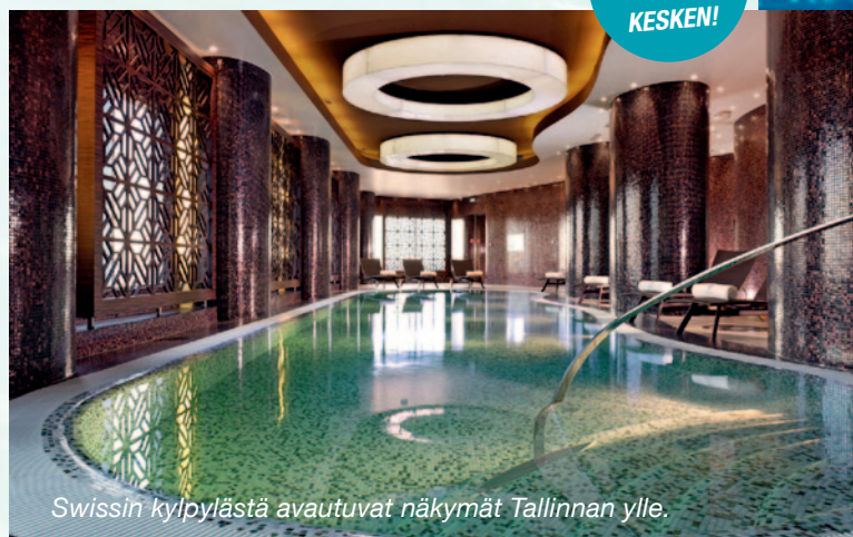
Swissin kylpylästä avautuvat näkymät Tallinnan ylle.