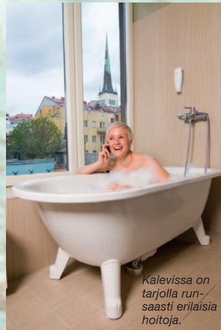
Kalevissa on tarjolla runsaasti erilaisia hoitoja.

Vastaanottokerroksen Cafe Mademoisellellä on erittäin laaja valikoima suolaisia ja makeita kahvilaherkkuja, kahvi-Macaronkeksi 3 e, lohiwrap 4,50 e, Mozzarella-salaatti 6,50 e ja olut (0,3) 4,50 e. Allasbaarissa smoothie 4 e ja Pina Colada -drinkki 10 e.