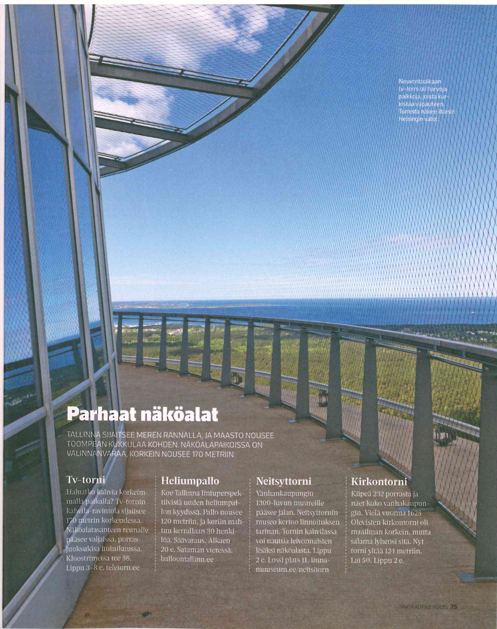
Neuvostoajkaan tv-torni oli harvoja palkkoja, joista kurtistaa vapautteen. Tornista näkee iltaisin Helsingin valot.