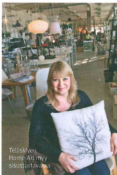
Telliskiven Home Art myy sisustustavaraa.