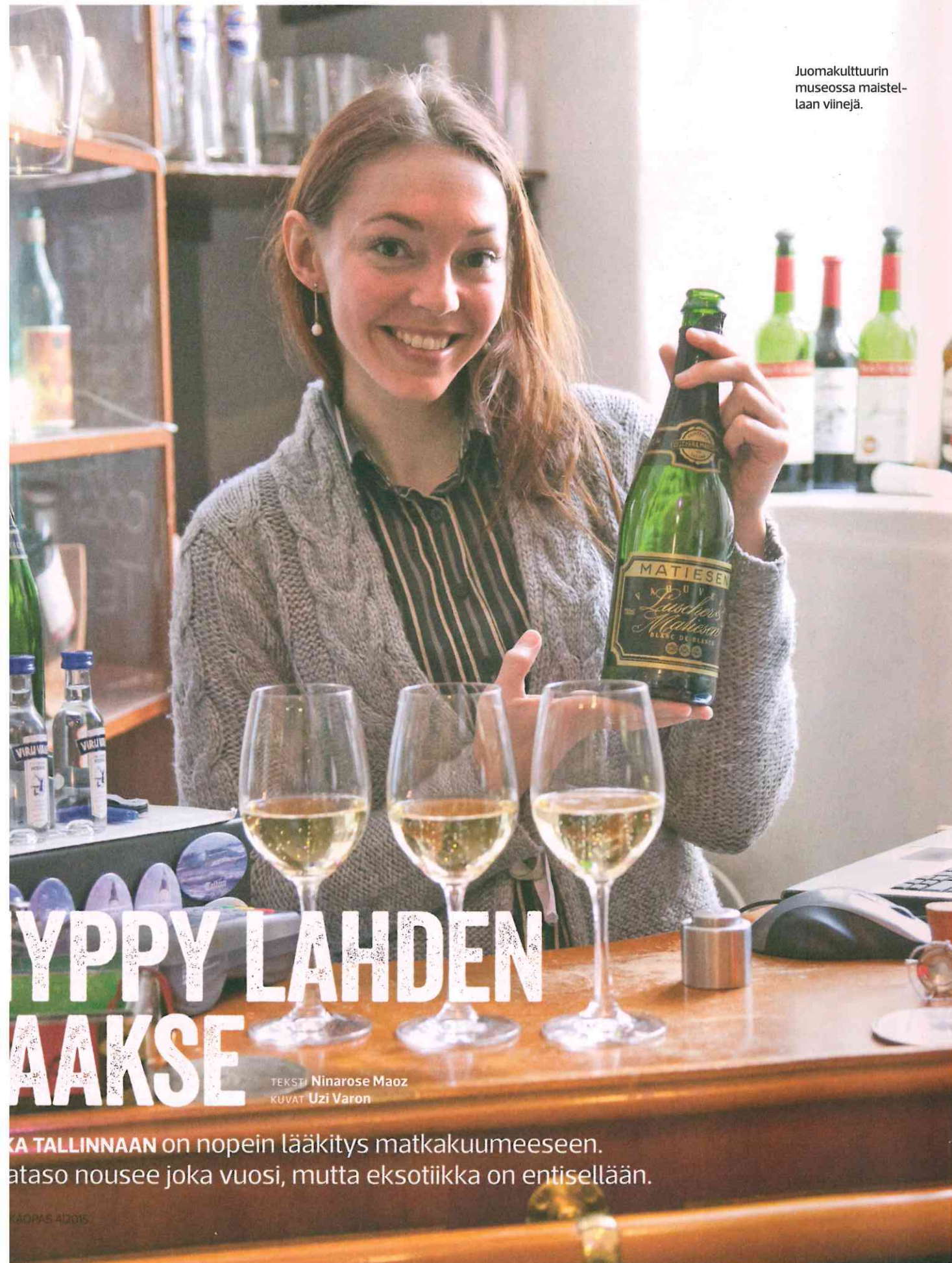
Juomakulttuurin museossa maistellaan viinejä.