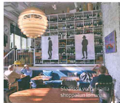
Sfäärissä voi ruokaila shoppailun lomassa.

Shoppailun jälkeen voi levähtää lähiravintolassa tai -kahvilassa, kuten Hetk, Basiilik ja Kaks Kokka. Hetk-klubilla järjestetään bileitä aamuun saakka.