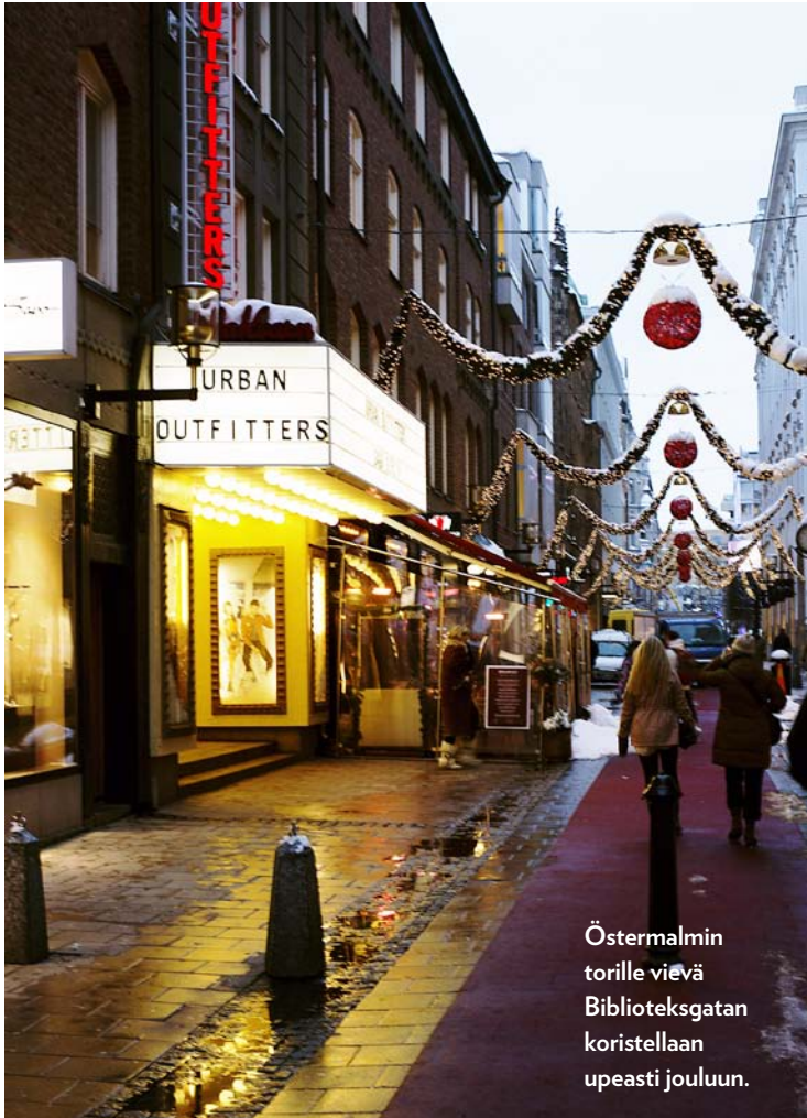
Östermalmin torille vievä Biblioteksgatan koristellaan upeasti joulun.