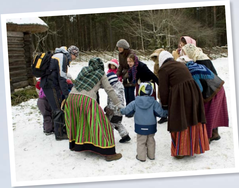
Viron ulkomuseossa lapset napataan mukaan perinteisiin piirileikkeihin.

Mestari- pihan tyhjät ja rapistuneet tilat käsityöläisten puodeiksi. Korujen lisäksi Pärn pyörittää pihalla myös pikkuista hotellia, jossa on yöpynyt jopa kuninkaalaisia – ihan incognito, tietenkin.