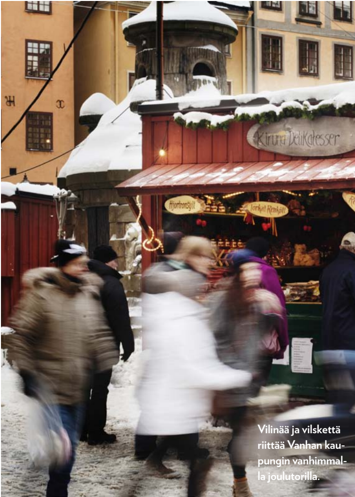
Vilinää ja vilskettä riittää Vanhan kaupungin vanhimmalla joulutorilla.